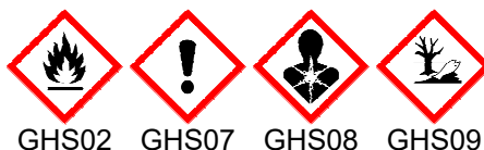
GHS02 GHS07 GHS08 GHS09